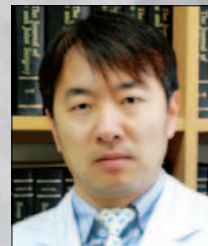
1. 상견갑 신경 마비의 관절경적 치료(15분) 유연식 (한림의대)